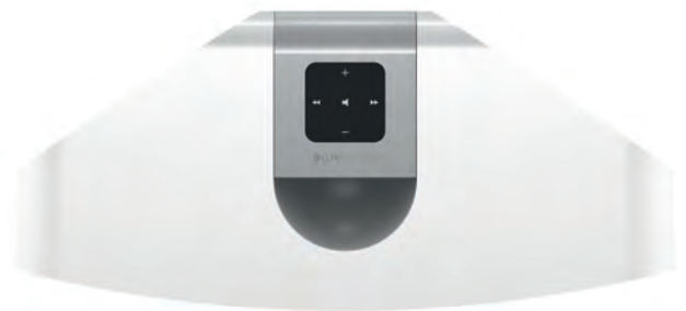
Bluesounds „Pulse“ ist als drahtloser Multiroom-Lautsprecher die unkomplizierteste Möglichkeit, guten Sound ins ganze Haus zu bringen

Das Bluesound-System ist nach seiner Einführung vor einiger Zeit erfolgreich in der Szene angekommen. Elegant gestaltete Player für den Einsatz in unterschiedlichen Räumen, entweder als „Powernode“ mit integrierten Verstärkern für vorhandene Lautsprecher oder als pure Variante „Node“ für den Anschluss an eine vorhandene HiFi-Anlage, machten das System von Anfang an universell. Die All-in-One-Lösung namens „Pulse“ als Lautsprecher mit kompletter Elektronik ist die unkomplizierte Erweiterung für zusätzliche Räume, in denen man bislang noch nicht in den Genuss von Musik kam. Für noch mehr Sound gibt es die Subwoofer/Satelliten-Kombination „Duo“. Um die geliebte CD-Sammlung endlich in den Ruhestand schicken zu können, gibt es zudem den Server „Vault“ mit integriertem Laufwerk, sodass man seine Sammlung bequem einmalig archi-