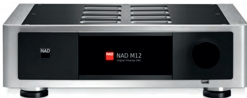
Der exzellente Vorverstärker M12 aus der Masters-Serie von NAD lässt sich mit dem passenden Modul in das Multiroom-System einbinden und bequem per App steuern