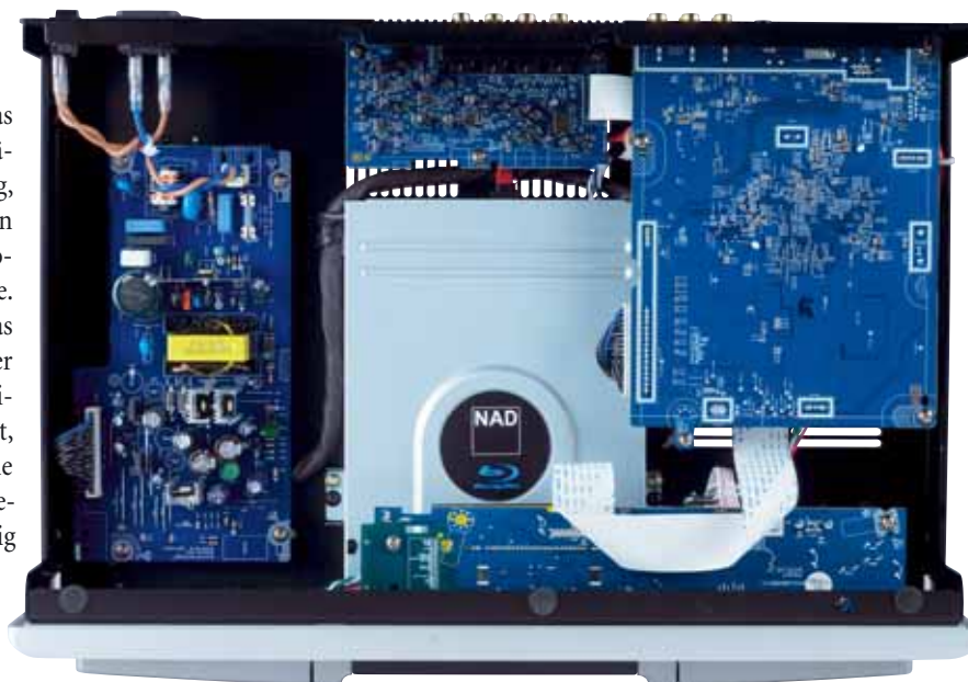
Solides, gekapseltes Laufwerk, ordentlicher Aufbau – so baut man heute gute Blu-ray-Player

Ungebrochen setzt der M56 die Familientradition von NADs Master Series fort. Sowohl bei der Wiedergabe von Blu-rays als auch bei der Aufbereitung von DVDs misst er sich mit den Besten des Marktes, lässt dabei die meisten hinter sich und hat sogar das Zeug zur echten Bildreferenz.