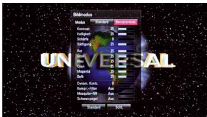
Vorbildlich: Das umfangreiche Menü der Bildoptionen, das mehr Einstellmöglichkeiten bietet als so mancher Fernseher. Da außerdem der Regelbereich der einzelnen Optionen praxistgerecht bemessen ist, ist ein perfekt optimiertes Bild möglich